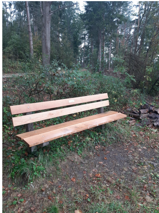
saniertes Bänkli beim Holzschof Homberg