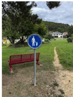
Ansicht vom Kindergarten