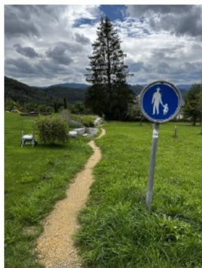
Ansicht von Gartenstrasse