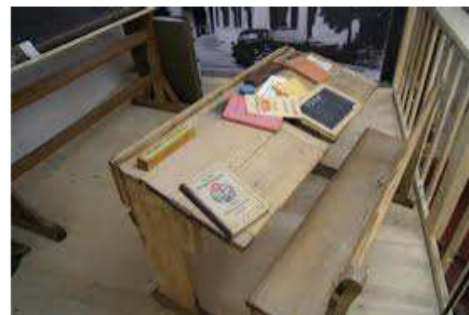
Alte Schulbank mit Lehrmitteln