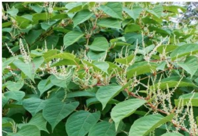
Stauden- oder Japan-Knöterich ( Reynoutria japonica )