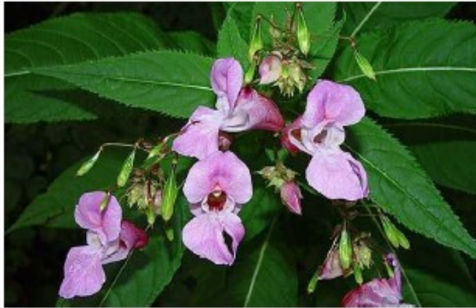
Drüsiges Springkraut ( Impatiens glandulifera )

Abbildungen zu Springkraut, Stauden- oder Japan-Knöterich und Berufkraut