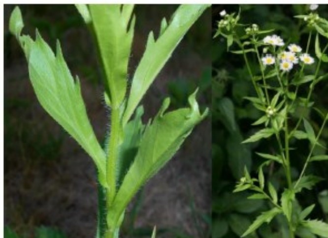
Einjähriges Berufkraut ( Erigeron annuus )