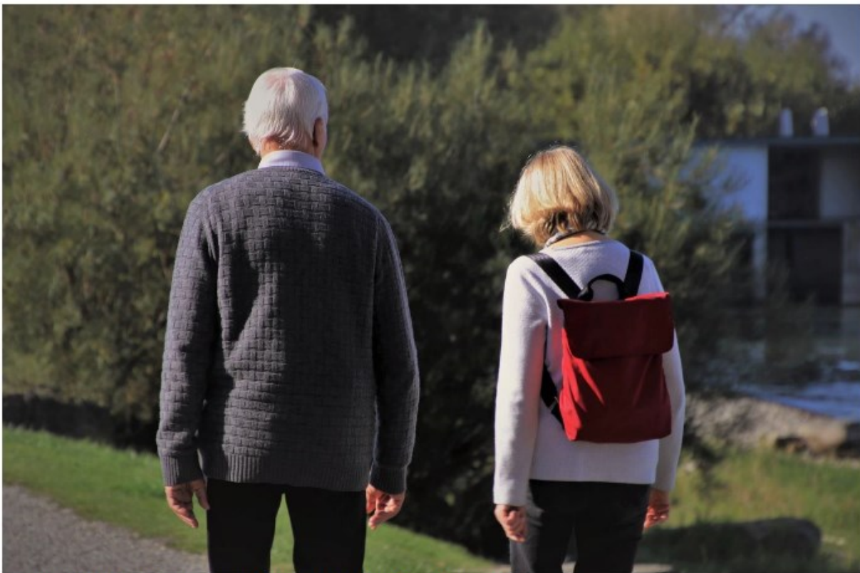
Freiwilliger Bewegungscoach begleitet Senior beim Spazieren