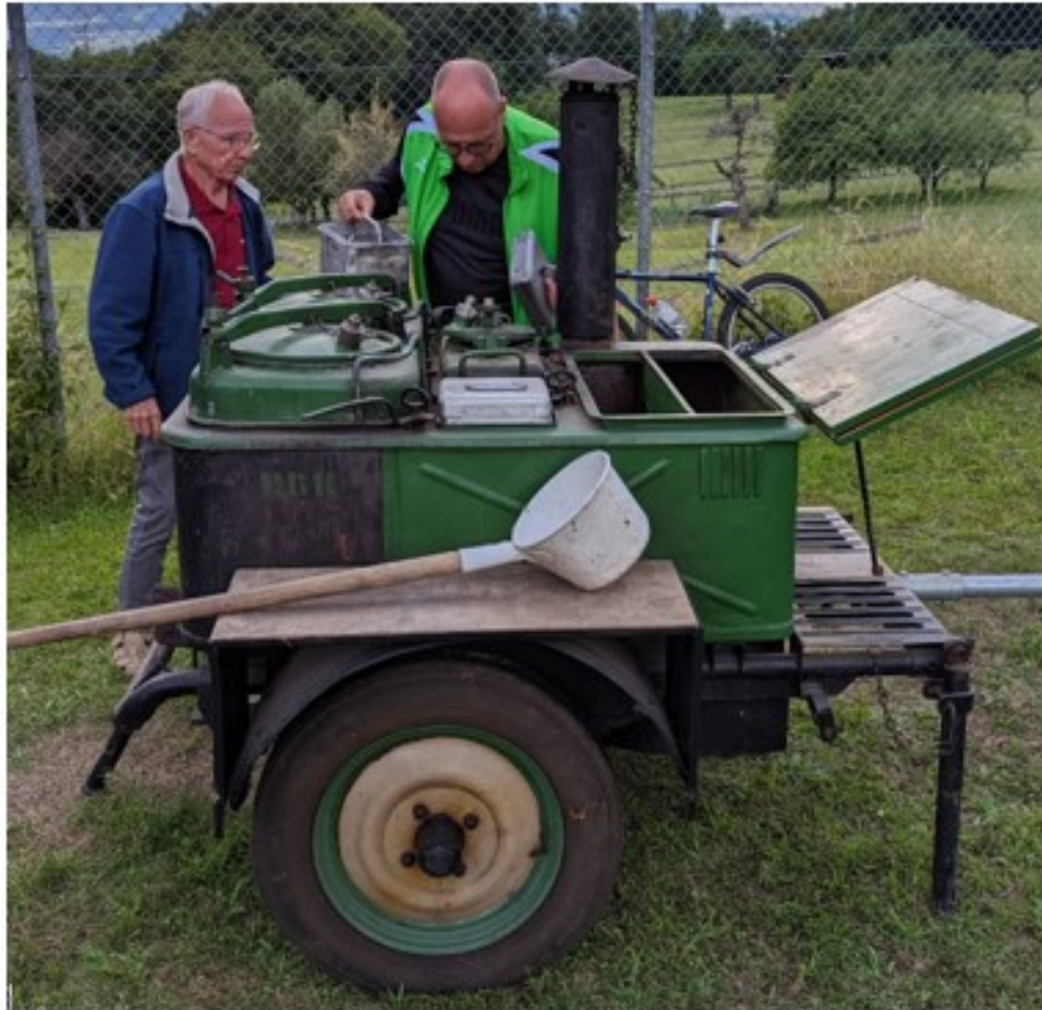
Sie wird wieder eingefeuert, die original ungarische Gulaschkanone!

Geniesse eine original ungarische Gulaschsuppe